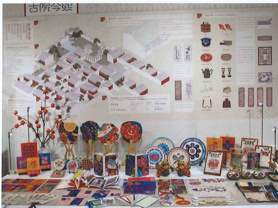
毕业设计作品《古院今熙》获 2022 南京市职业院校技能大赛文化旅游创意设计赛项一等奖