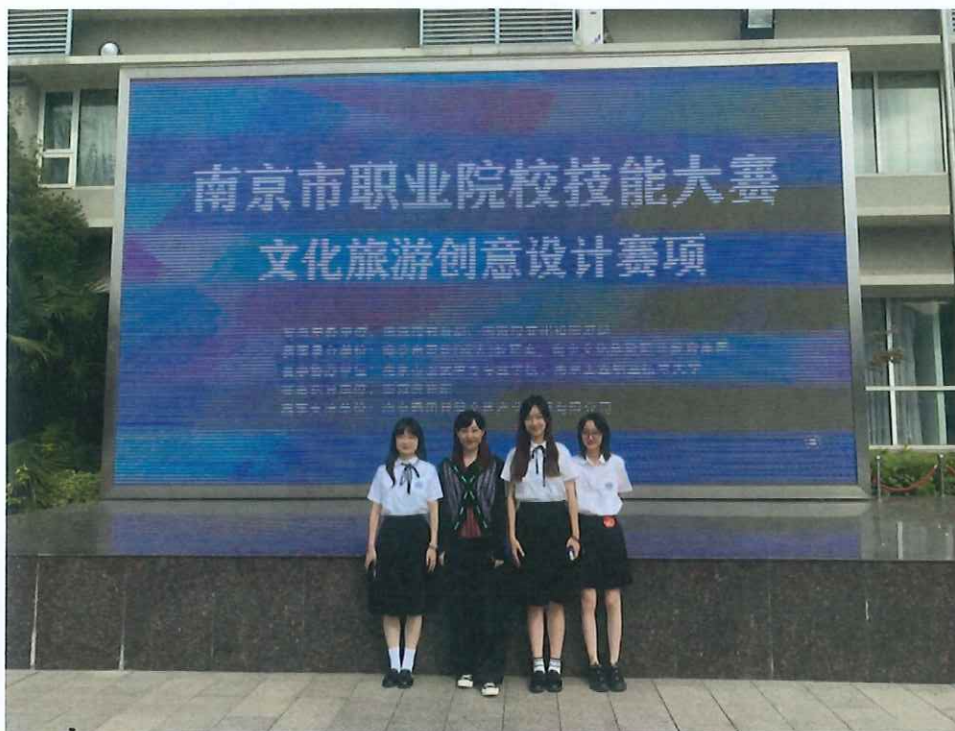
毕业设计作品《古院今熙》参加 2022 南京市职业院校技能大赛文化旅游创意设计赛项获得一等奖