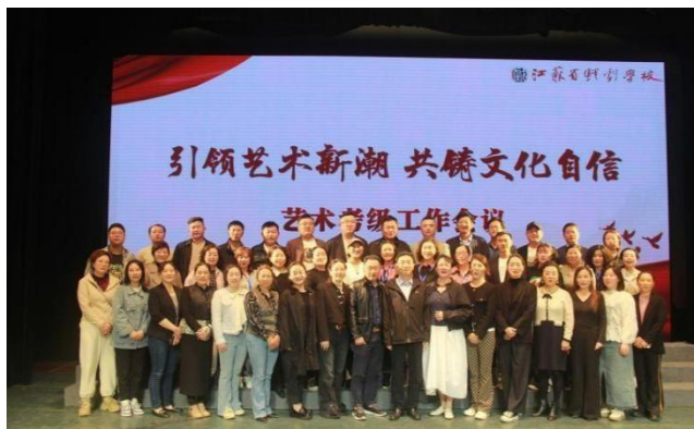
图 4-1 社会艺术考级会议合影