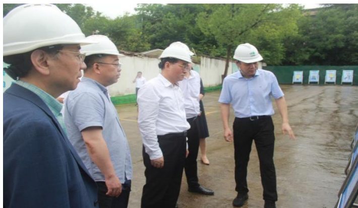
图 2-2 在学校天目湖校区实地考察

文化和旅游厅与江苏省演艺集团、溧阳市人民政府签订的《框架协议》，推进文旅融合示范基地建设，多次进行实地调研并召开现场办公会，全面推进建设项目具体实施工作。11月，“江苏省戏剧学校产教融合实训基地”“天目湖文旅融合创新基地”揭牌。2024年4月，升级改造项目一期工程施工单位已经进场，并将于年底竣工。