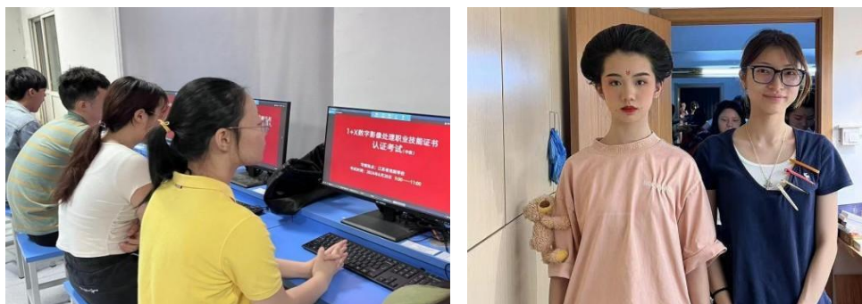
图 4-3 “1+X”职业技能认证考试（中级）现场

2024 年 6 月，江苏省戏剧学校首次承办“1+X”职业技能认证考试（中级），包括人物化妆造型和数字影像处理两类“1+X”职业技能认证考试（中级）。“1+X 证书制度”是完善职业教育培训体系、深化产教融合、校企合作的重要制度设计，是构建中国特色职教发展模式的重大制度创新。本次考试旨在通过结合学历证书与职业技能等级证书，检验学生专业技能，助力学生全面成长，促进高质量充分就业。