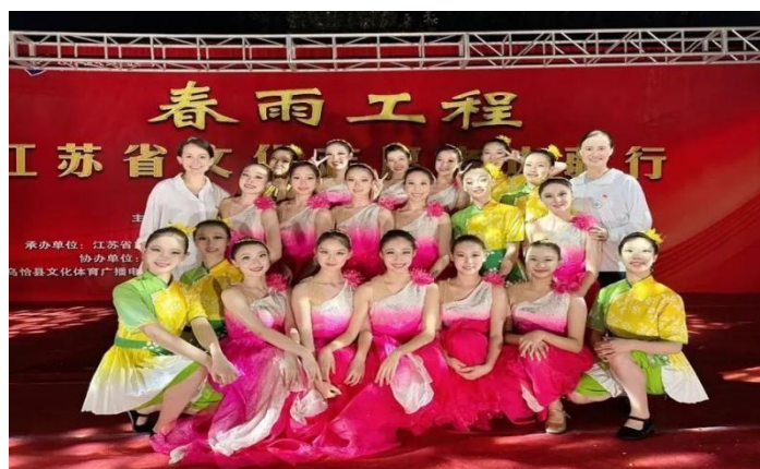
图 4-6-1 参加春雨工程

2023 年 9 月，在省文旅厅的指导下，开展捐赠乐器和乐器演奏教学公益培训，募捐钱物送到边疆地区中小学校，2024 年 4 月，学校与伊犁中等职业技术学校、伊犁州歌舞剧院签订《合作框架协议》。8 月，学校志愿团队参加“春雨工程——江苏省文化志愿者边疆行”活动的 5 场演出。学校选派 2 名教师前往克州阿图什市的克州歌舞团协助做好戏曲人才培训工作。江苏省戏剧学校通过为新疆地区培养文化艺术人才、提供志愿服务表演等形式，共促两地艺术职业教育高质量发展。