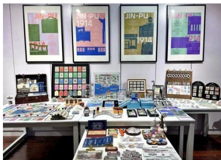
图 4-2 津浦 1914

技能大赛文化旅游创意设计赛项一等奖的同时，也与南京一设计公司签订了版权合作协议。