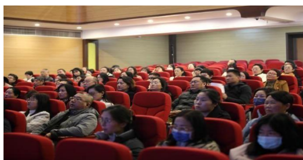
图 7-2 教职工观看警示教育片

2024 年 3 月，学校召开 2024 年度全面从严治党工作会议。会议传达学习省文旅厅系统全面从严治党工作会议精神，回顾总结 2023 年学校全面从严治党工作落实情况，安排部署 2024 年学校全面从严治党工作目标和任务。会上签订《党风廉政建设责任书》。全体教职工观看警示教育片《一体推进不敢腐、不能腐、不想腐》。