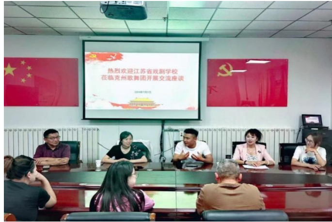
图 4-6-2 教师援疆