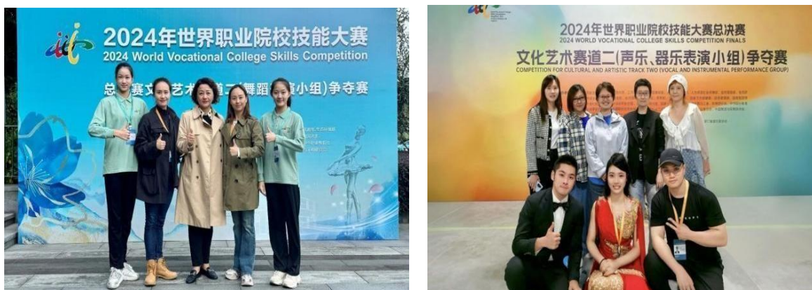
图 6-2 世界职业院校技能大赛