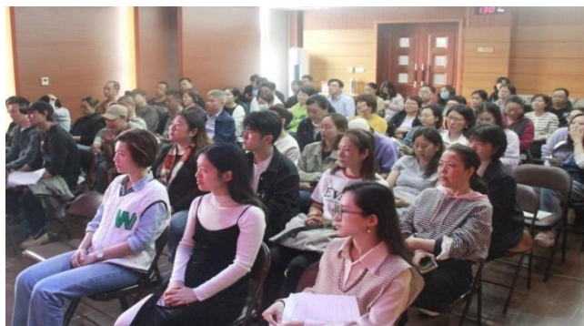
图 7-3 教职工代表大会