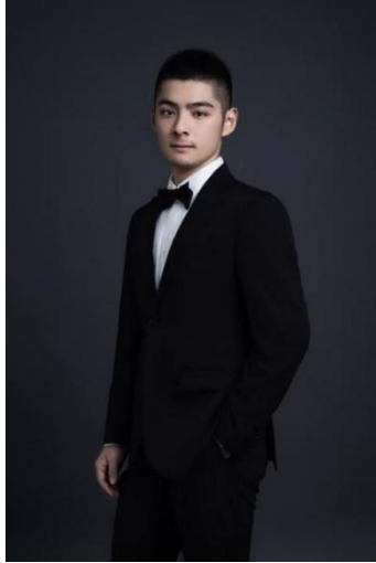
图 3-6 优秀毕业生照片