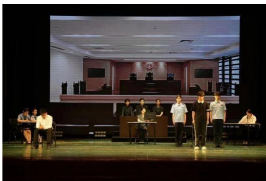
图 3-2 “模拟法庭”照片

场进行了展演。通过正面引领和反面警示，进一步加强师德师风建设，强化纪法意识、筑牢纪法防线。