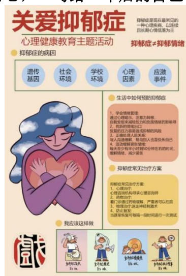
图 3-5-2 心理健康知识科普海报