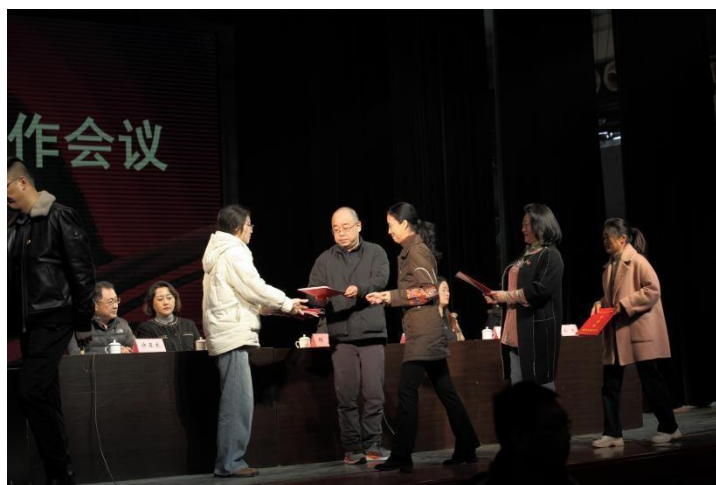
图 7-1 签订党风廉政建设责任书

训班、组织排演红色主题剧目、开展学生志愿服务等活动，促进党建与思政教育、教学教研、学生管理、社会服务等深度融合。