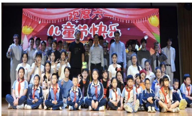
图 4-5 戏剧影视表演专业师生与南京市聋人学校合影留念

2024 年“六·一”儿童节期间，戏剧影视表演专业以儿童剧赛事为契机推出《米奇妙妙屋》《猫鼠之夜》等六个儿童剧作品，朗诵《毛泽东诗词》（节选）等参加了江苏省戏剧学校、南京市鼓楼幼儿园、南京市聋人学校和南京市琅琊路小学四场演出活动。本次送戏进校园社会服务活动，推动教育资源的共享与协作，并为儿童剧美育教育搭建了良好的社会实践平台。