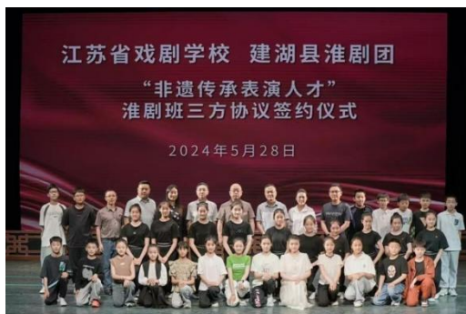
图 2-4 合作办学签约仪式

学校以现代文化艺术产业发展需求为导向，以产学研紧密结合为依托，把文化艺术产业先进元素及时纳入教学标准和教学内容，由人才“供给—需求”单向链条，转向“供给—需求—供给”闭环反馈。学校为江苏各级文艺院团“订单式”培养戏曲专业演（奏）员，实现与院团需求零距离接触。2024 年，江苏省戏剧学校与江苏省演艺集团锡剧团、建湖县淮剧团开展联合招生，为院团定向委培戏曲表演人才。