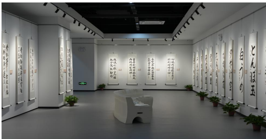
图 6-3 第十届中日青少年书法作品交流展征集

本青年来校访问。学校也曾先后 7 次 129 受邀赴日本访问交流，带去了具有中国特色、江苏特色的戏剧、音乐、舞蹈等文艺演出，受到日本多家媒体宣传报道。为进一步加强中日两国青少年书法爱好者交流与友好合作，“第十届中日青少年书法交流展”拟定于 2024 年 11 月在江苏省艺术馆举办，以期以书法作品交流促进国际文化交流与合作，传播中华优秀传统文化，讲好中国故事。