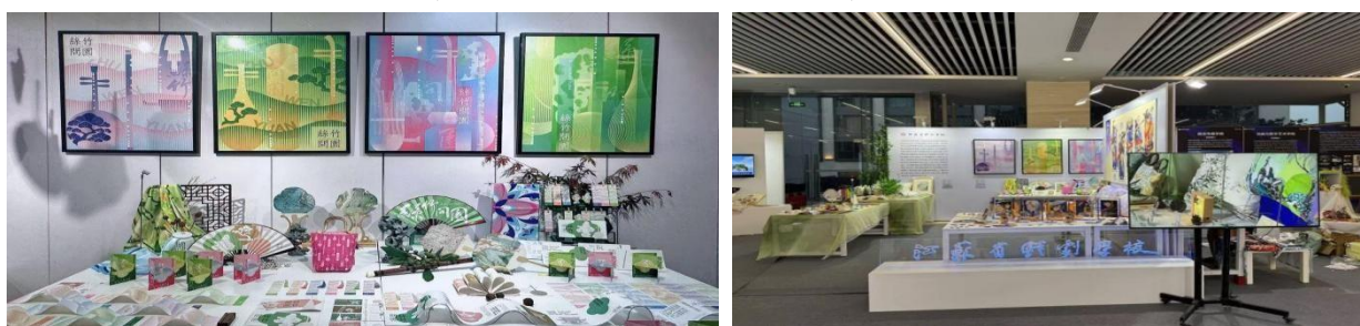
图 3-4 部分毕业设计作品

学校艺术设计专业紧抓毕业设计工作。2024 年,以南京地域文化、非遗文化为主题,结合新工艺、新材料、新技术,对南京本土文化与旅游资源进行创意设计与实践,设计出多组优秀原创作品及文化旅游创意衍生品。设计作品《丝竹问园》《逸游魏晋》均获 2024 南京市职业院校技能大赛文化旅游创意设计赛项一等奖,在 2024 江苏联合职业技术学院优秀作品展评选中均获一等奖,入围第十一届“紫金奖”文化创意设计大赛决赛。两组作品获得南京六朝博物馆、南京夫子庙文旅集团的关注,后续进一步合作交流,将作品转化为商品。