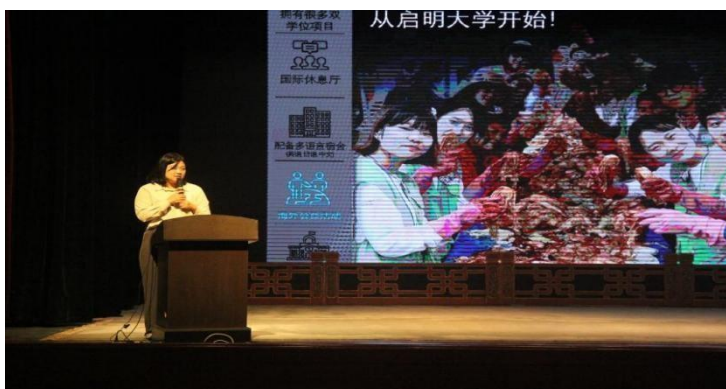
图 6-1 说明会