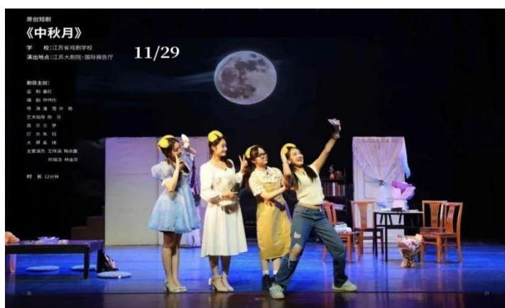
图 5-1-2 原创短剧《中秋月》