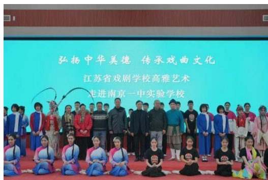
图 5-3 戏曲进校园

为深入学习贯彻习近平文化思想和习近平总书记考察江苏重要讲话精神，保护传承弘扬中华优秀传统文化，由省戏剧学校牵头，统筹各方资源开展“戏曲进校园”活动。12月8日下午，“戏曲进校园”首场活动在溧阳市天目湖镇中心小学拉开大幕。来自省文旅厅、溧阳市的领导及文化艺术领域的专家等各界人士出席活动。27日下午，省戏剧学校高雅艺术走进南京一中实验学校，29日，活动走进马府街小学。活动现场为学生们介绍生旦净丑戏曲人物知识，讲解戏曲服装、戏曲行当等内容，并进行勾脸互动。活动通过面对面表演戏曲节目，让学生更直观地了解戏曲、欣赏戏曲、热爱戏曲。活动参与人数超3000人，被新华日报、江苏教育频道等23家媒体报道。