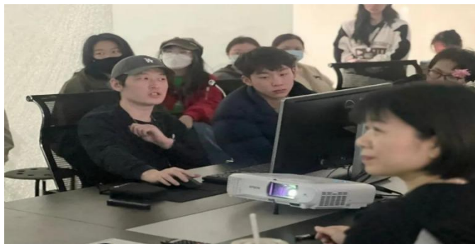
图 2-1 学生在企业实践、实训

融合。2024 年 5 月，学校 20 级动漫专业学生走进南京三叠色艺术科技公司，开展为期两周的专业实践与学习活动。学生们在企业老师带领下参与实践项目，深入了解动漫产业的运作模式、设计软件和制作的技术与流程。通过实训实践，学生们提升了专业技能，培养了创新意识和团队合作精神，为未来的职业发展打下坚实基础。