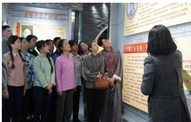
图 5-2 思政教学实践课