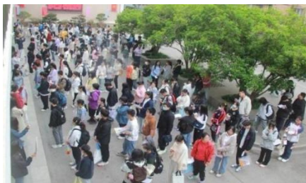
图 1-3 招生文化考试

学校继续优化招生方案，全力做好各项招生服务工作。一是拓宽宣传渠道。编制《2024 年招生简章》，在学校官网官微、水韵江苏微信公众号等平台广泛宣传。开通招生咨询服务热线、建立招生 QQ 咨询群，全天候解答报考疑问。二是创新招生模式。继续依托线上考试服务平台开展线上报名、正式考试等工作，提高效率。