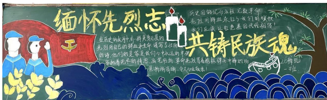
图 3-1 学校开展主题黑板报评比

为深化青少年爱国主义教育，学校开展了“缅怀先烈志，共铸民族魂”主题班会活动。活动通过主题演讲、集体讨论等形式，融思想性、教育性、知识性于一体，为同学们提供了展示风采、互相交流学习的机会，也让大家在润物无声中接受思政、德育教育，从而形成良好班风。