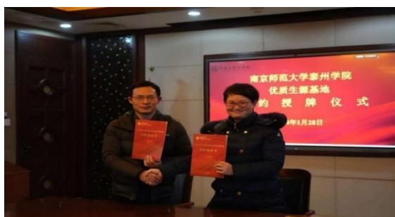
图 2-3 两校签订合作协议

2024 年 1 月，江苏省戏剧学校与南师大泰州学院签署合作协议，以习近平文化思想“两个结合”为引领，以教育部全面实施的美育浸润行动为契机，拟在招生就业、人才培养、学术研究等方面展开广泛交流与深入合作，构建五年一贯制高职“专转本”优质生源人才培养体系。