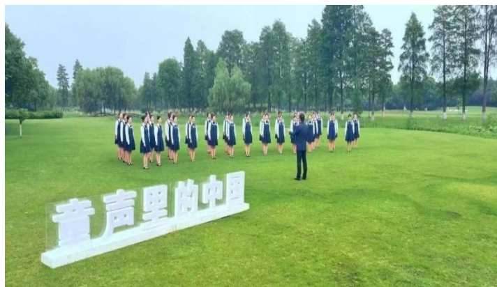
图 5-1-1 童声里的中国

声里的中国”全国 100 首优秀合唱作品之列，同学们用纯真的心灵和清澈的歌声表达了新时代少年儿童爱国之情；戏剧影视表演专业原创短剧《中秋月》入围 2024 年江苏省大学生戏剧展演活动；艺术设计专业以戏曲元素等为学生毕业设计出发点，让艺术设计作品体现出传统文化和地域文化特色。