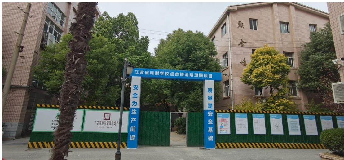
图 1-1 点金楼消险加固项目施工现场

为扩展办学场所，学校开展点金楼消险加固项目，预计明年 9 月正式投入使用。为打造精致校园，开展校园安全与环境提升工程，完成新门头改造、食堂改造、浴室改造等工作。为满足学生日益增长的生活与教学需求，完成学生宿舍新空调、教室桌椅等。