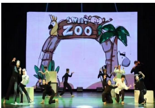
图 4-4 原创儿童剧《远山动物园》

2024 年 7 月，戏剧影视表演专业原创儿童剧《远山动物园》入围上海国际儿童戏剧艺术节“点燃想象力”原创儿童剧孵化计划。本剧向观众传达保护动物、关爱自然的理念，启发大家形成保护动物、爱护环境的意识，尤其引导孩子们树立正确的价值观，成为具有社会责任感和大自然保护意识的新一代。《远山动物园》是学校编创的一部具有教育意义的生态环境教科书般的音乐剧作品。